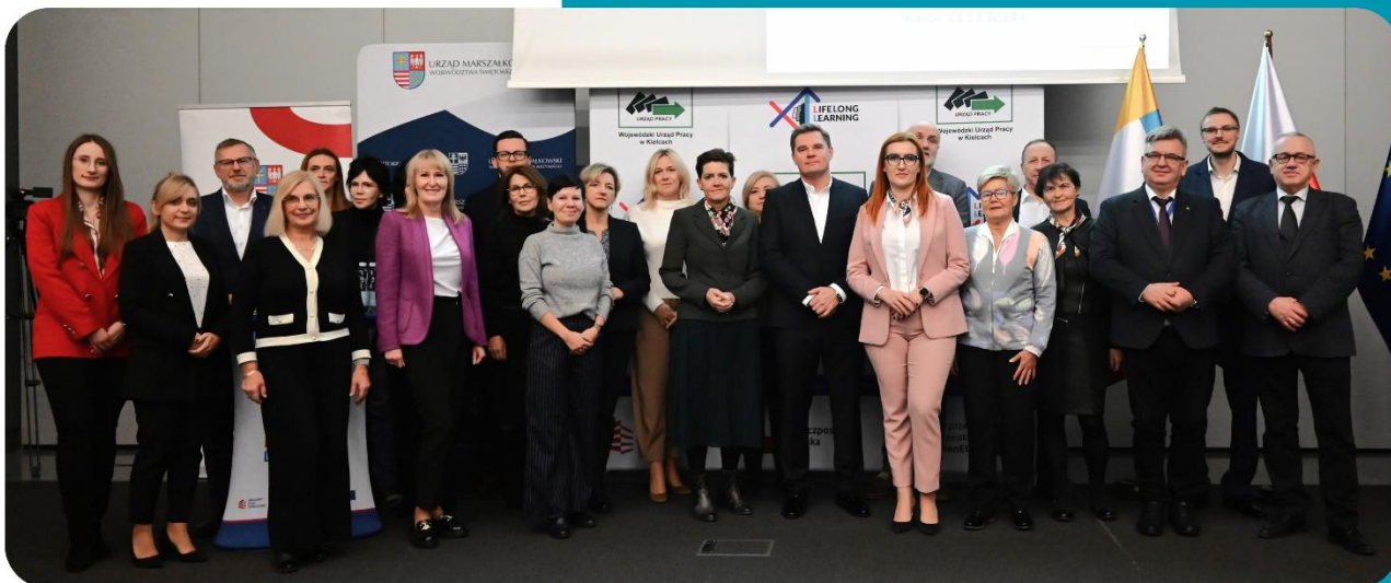
Zdjęcie przedstawiające ekspertów, którzy wzięli udział w Regionalnym Okrągłym Stole LLL w dniu 21.11.2024 r.